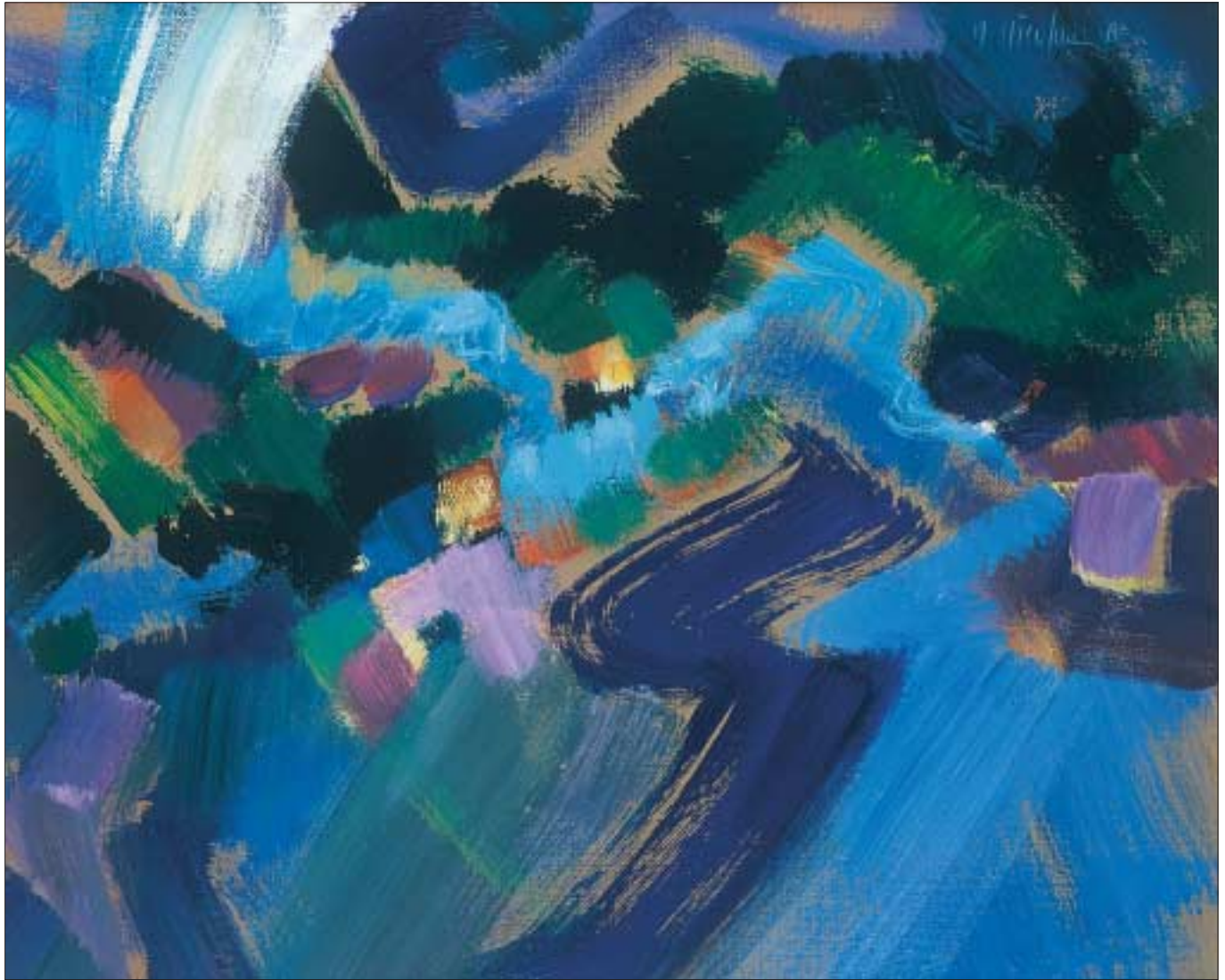
Le ruisseau (2004) ; acrylique sur toile, H : 0,38 m × L : 0,46 m The brook ; acrylic on canvas