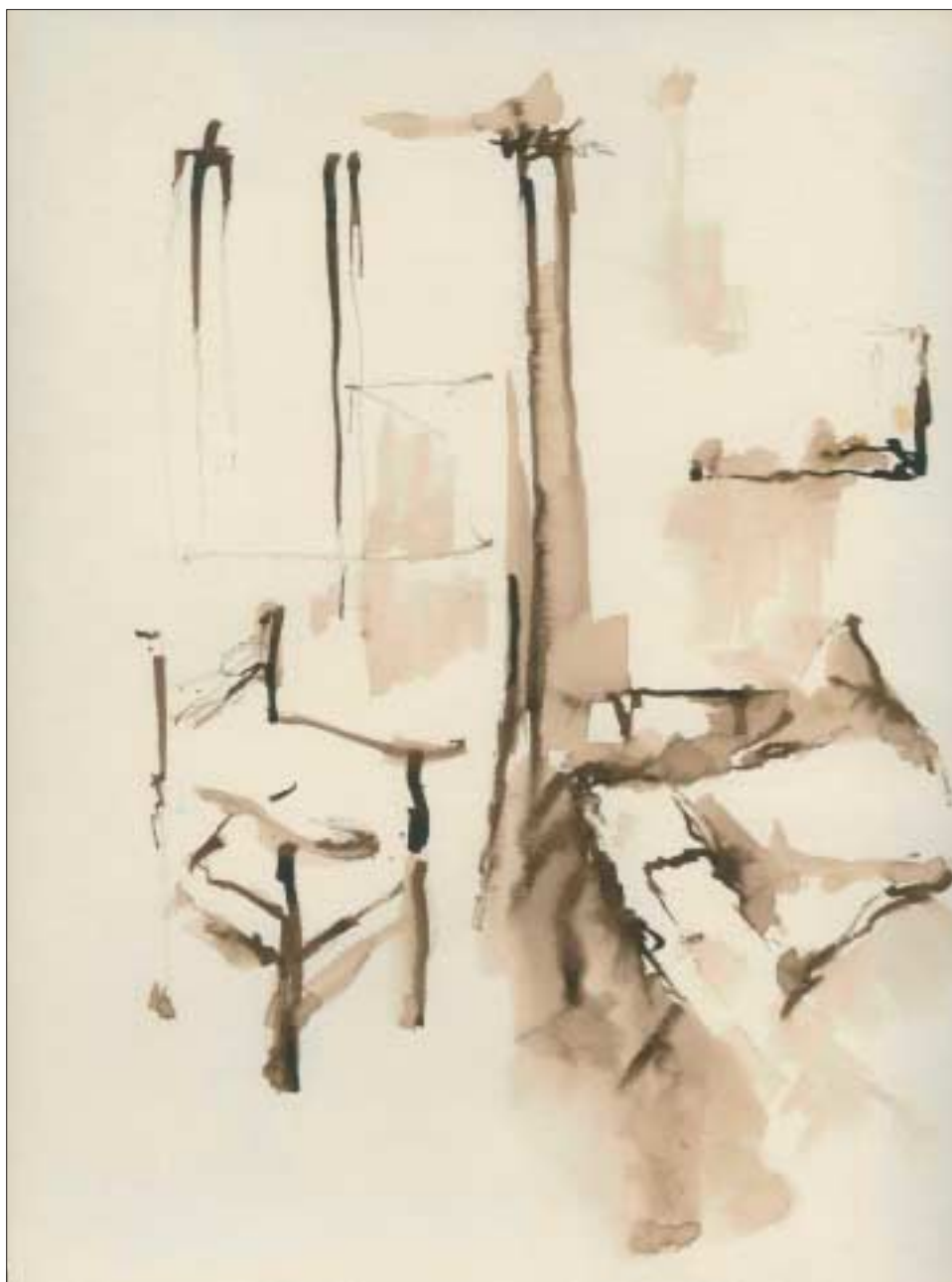
La chambre de l'artiste (1979) ; lavis, H : 0,30 m × L : 0,23 m The artist's bedroom ; wash-drawing