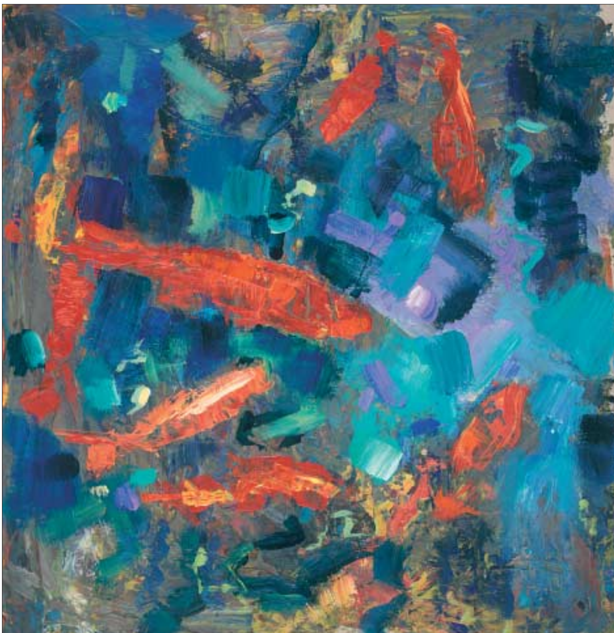
Les poissons rouges ; acrylique sur carton marouflé sur toile, H : 0,365 m × L : 0,355 m The goldfish ; acrylic on cardboard laid down on canvas